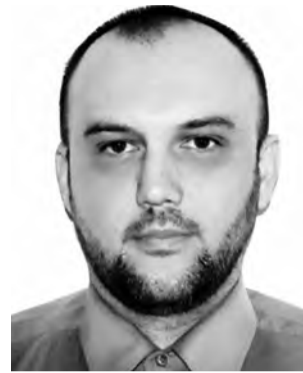
PIŠE: Fahrudin Vojić

Živimo u vremenu u kojem se riječi proizvode masovno, a djela pojedinačno. Informacije se šire brže od odgovornosti. Mišljenja se gomilaju brže od odluka. Kao da smo izgradili čitavu civilizaciju govora koja stoji na sve slabijim temeljima djelovanja. Nikada čovjek nije znao više — i nikada to znanje nije imalo manju težinu. Danas je moguće satima govoriti o istini, a nikada joj se ne približiti. Raspravljati o moralu, a ne učiniti ni najmanji moralni napor. Analizirati svijet do najsitnijih nijansi, a ostati potpuno nepromijenjen. Kao da smo povjerovali da razumijevanje može zamijeniti odgovornost, a objašnjenje djelovanje. U tome leži tiha bolest savremenog društva - pretvaranje znanja u dekor. Znanje više ne služi preobražaju, nego statusu. Ne služi karakteru, nego identitetu. Ne služi istini, nego poziciji.