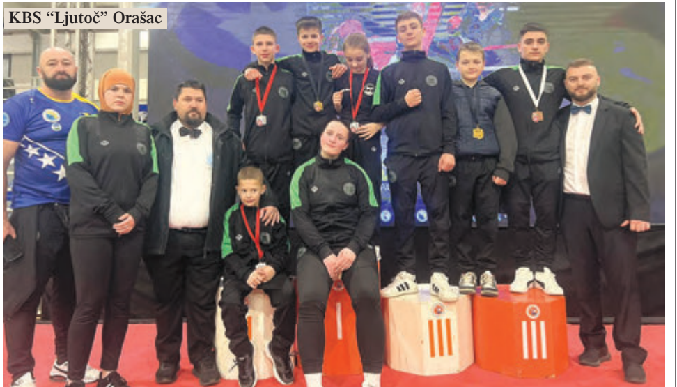
KBS "Ljutoč" Orašac