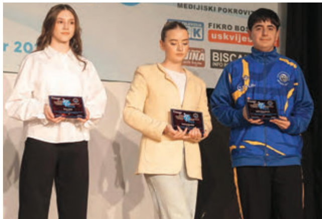
▲ Reprezentativci Bosne i Hercegovine