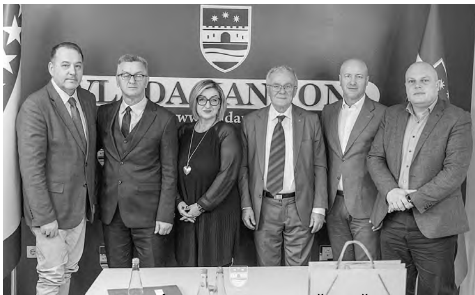
DELEGACIJA VIJEĆA KONGRESA BOŠNJAČKIH INTELEKTUALACA PREDSTAVILA PROJEKTE

Predstavnici zakonodavne i izvršne vlasti Unsko-sanskog kantona primili su delegaciju Vijeća kongresa bošnjačkih intelektualaca (VKBI).