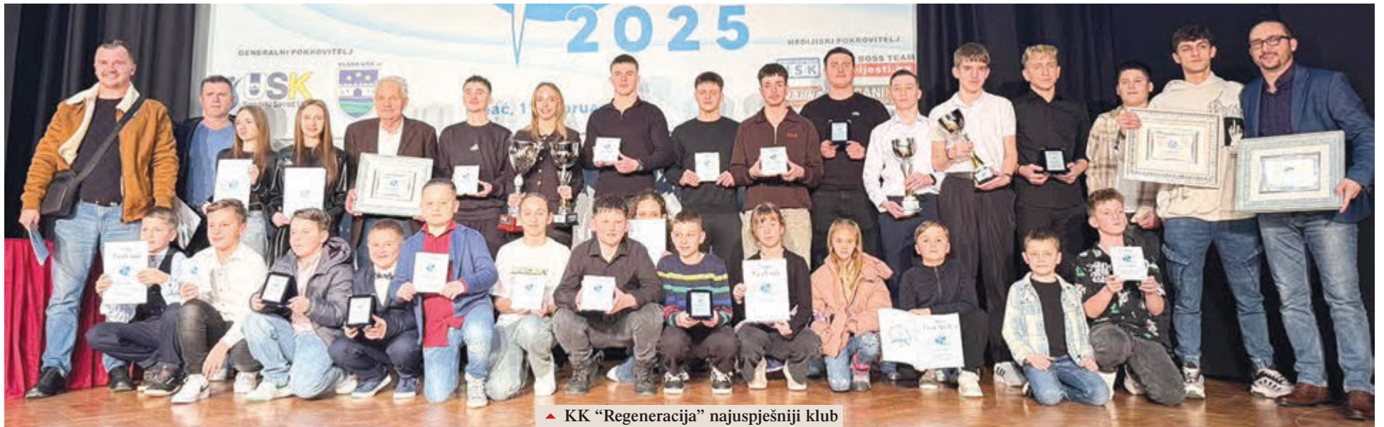
▲ KK "Regeneracija" najuspješniji klub