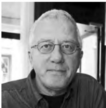
PIŠE: prof. dr. Nedžad BAŠIĆ

sudbina ne može pokrenuti čovjeka iz njegove očajne ravnoteže straha, siromaštva i neznanja. On još nema prezira prema sopstvenoj mržnji, nema otpora prema ljudskoj uzaludnosti, gluposti i pohlepi, nema odbojnosti prema besmislenosti zla, podvali, laži, licemjertvu i dvoičnosti. On nema ni snage ni volje da bi svoju sudbinu promijenio.