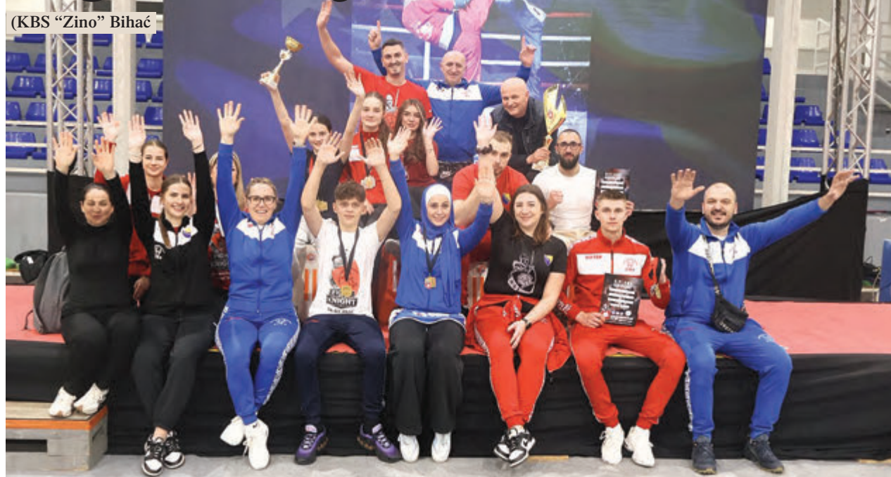
(KBS "Zino" Bihać)

Događaj je kako je istaknuto značajan za razvoj kickboxinga u Unsko-sanskom kantonu. Kickboxing klubovi sa područja Unako-sanskog kantona nekoliko godina unazad su po masovnosti, broju reprezentativaca i ostvarenim rezultatima na međunarodnoj kickboxing sceni u samom vrhu BiH što su pokazali i ovog puta na održanom takmičenju u Bihaću. Takmičenje je održano na četiri tatamija i ringu u nekoliko disciplina i velikom broju težinskih i staronih kategorija. Iz Unsko-sanskog kantona učestvovalo je osam klubova (KBS "Zino" Bihać, KBS "Ljutoč" Orašac, KBS "Tigar" Cazin, KBS "Serhat" Bosanska Krupa, KBS "Pokoj" Bihać, KBC "Bihać", KBK "Galaja" Sanski Most, KBV "Kurto" Bihać). Klubovi iz Unsko-sanskog kantona imali su zapažene rezultate te su osvojili ukupno 170 medalja od čega 41 zlatnu, 62 srebrene i 67 bronzanih.