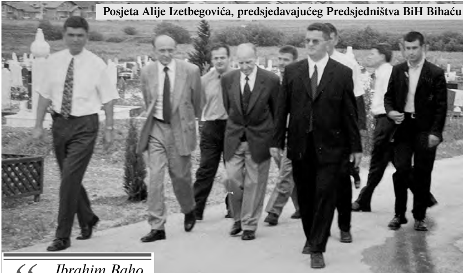
Posjeta Alije Izetbegovića, predsjedavajućeg Predsjedništva BiH Bihaću