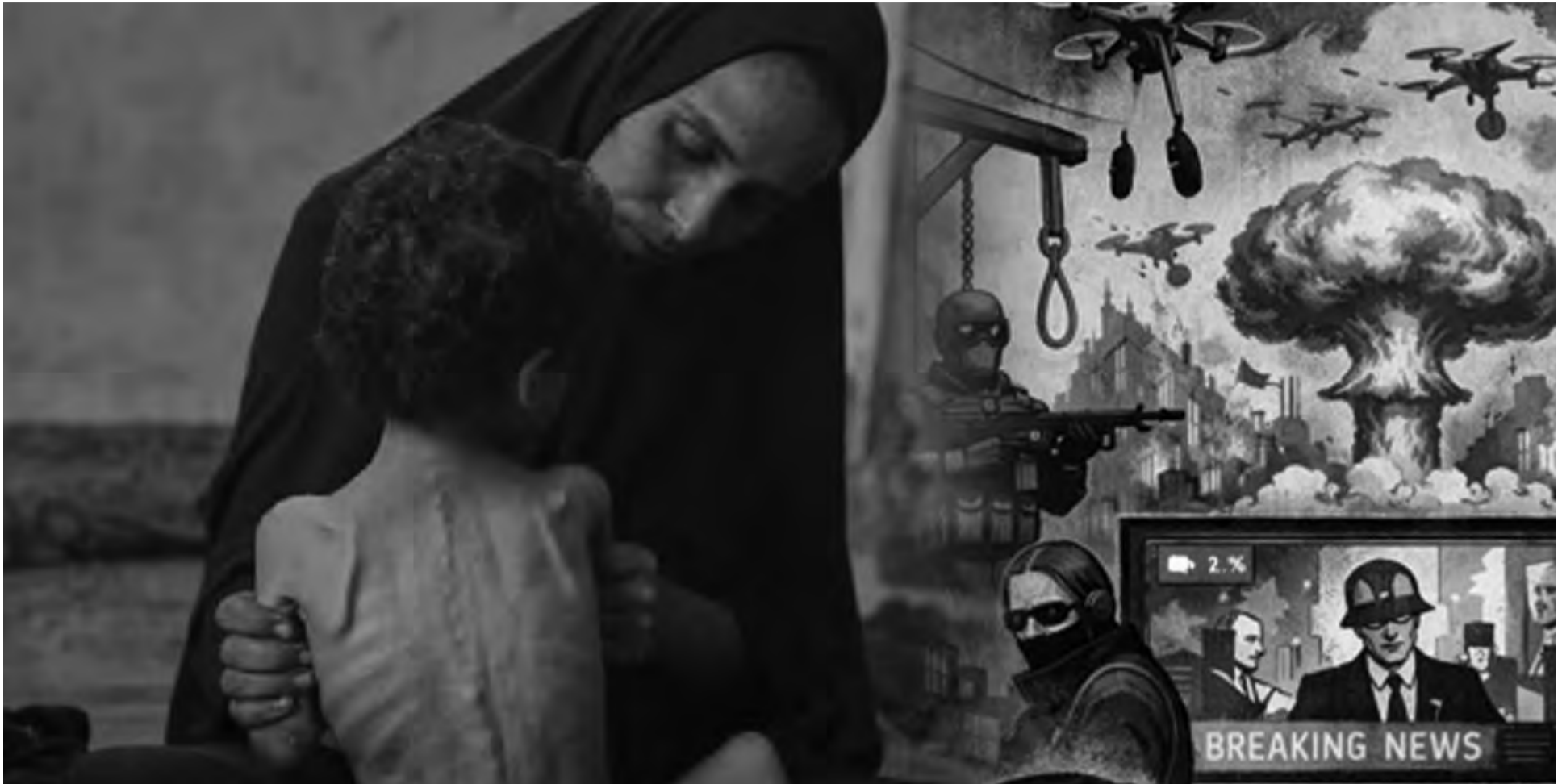
Ilustracija: O. Delić