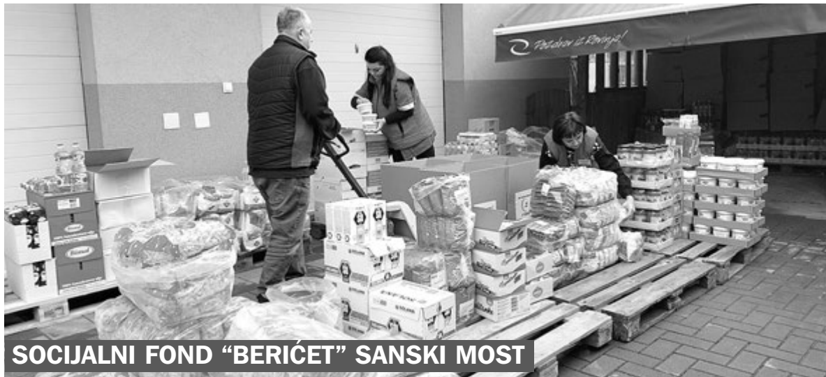
SOCIJALNI FOND "BERIČET" SANSKI MOST