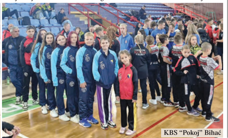
KBS "Pokoj" Bihać