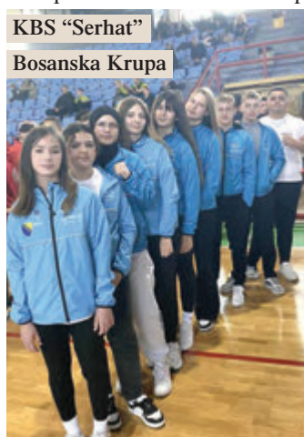
KBS "Serhat" Bosanska Krupa