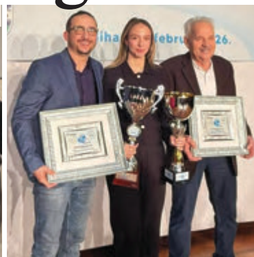
▲ Najuspješniji trener, karatista, ekipa